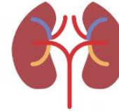
ระบบสารสนเทศเพื่อการให้บริการผู้ป่วย ไตวายเรื้อรังระยะสุดท้าย