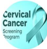
ระบบบริการตรวจคัดกรองมะเร็งปาก มดลูก