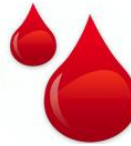
ระบบบริหารโรคเลือดออกง่ายฮีโมฟีเลีย