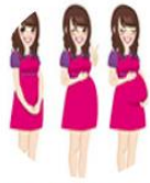
ระบบบริการฝากครรภ์